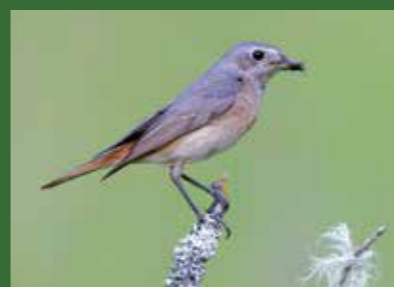
GEKRAAGDE ROODSTAART

Waar de mannen goed te onderscheiden zijn, zijn het de vrouwtjes die sterk op elkaar (kunnen) lijken. Vrouwtjes zwarte roodstaart zijn vrijwel geheel effen koudgrijs. Vrouwtjes gekraagde zijn eerder warm lichtbruin met lichte keel en onderdelen.