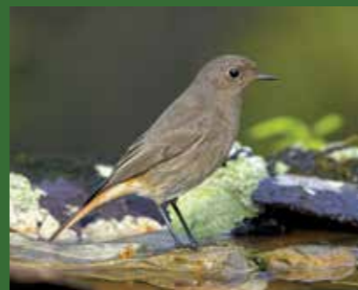
ZWARTE ROODSTAART