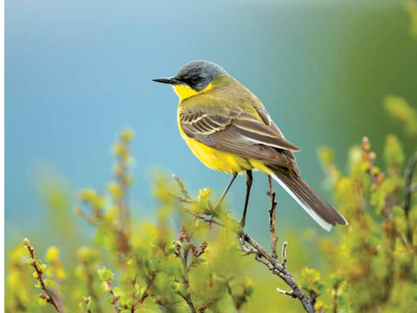
NOORDSE KWIKSTAART

> GROTE GELE KWIKSTAART De grote gele kwikstaart verrast keer op keer. Niet alleen door z'n schoonheid. Hij duikt soms op onverwachte plaatsen op. We kennen hem als bewoner van heldere beekjes in vooral het oosten en zuiden van ons land. Maar ze kunnen ook ineens opdruken bij sluiscomplexen, slootjes met slikranden, vijvers bij landgoederen en installaties voor rioolwaterzuivering. Daar weten ze in Brabant alles van. De laatste decennia groeide de populatie er tot enkele tientallen paartjes, onder meer bij