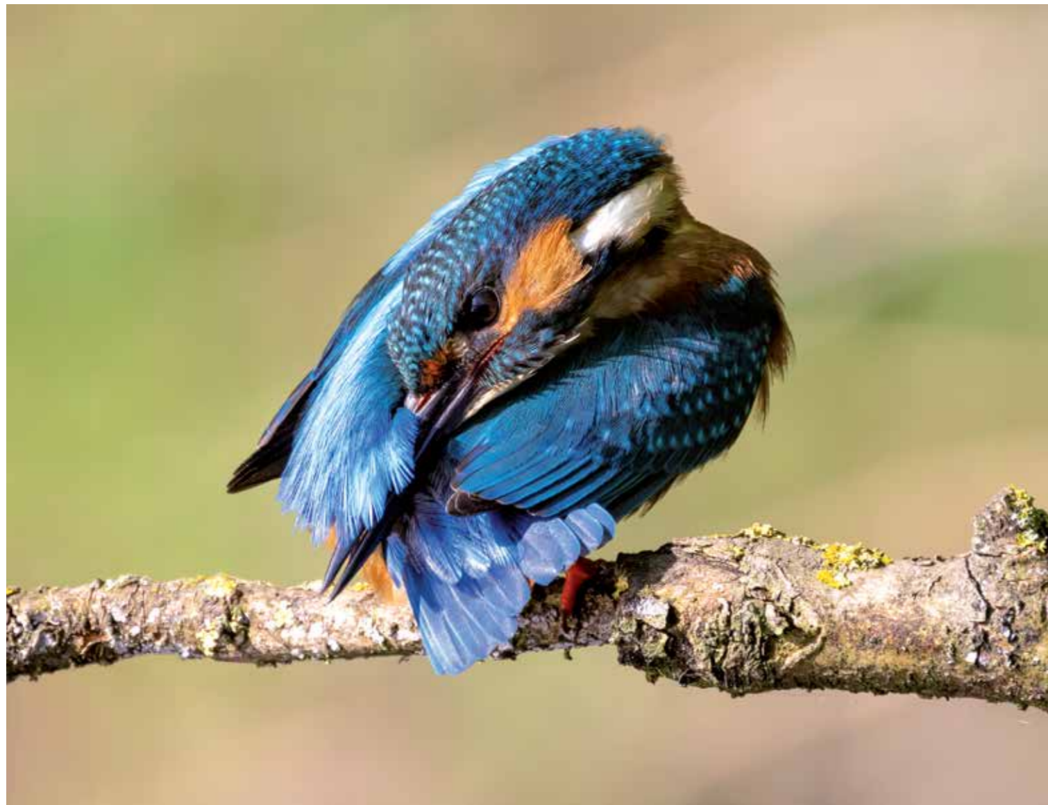
IJSVOGEL Servan Ott