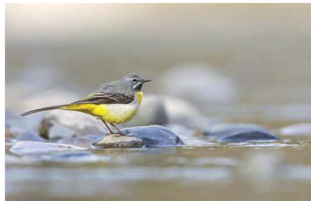
GROTE GELE KWIKSTAART

>> ENGELSE KWIKSTAART De Engelse kwikstaart: is het een aparte soort of toch een ondersoort van onze gele kwik? To be, or not to be, that's the question. Waar ons mannetje gele kwikstaart zich ooit met een prachtig blauwgrijs maskertje, moet de Engelsman deze verfraaiing missen. De Engelse kwikstaart heeft z'n thuisbasis in Midden- en West-Engeland en de kusten van Bretagne tot Zuid-Noorwegen. Als de vogels vanaf april terugkeren uit hun West-Afrikaanse winterkwartieren, trekt een deel door onze kuststreek. Ooit enkele honderden, nu nog slechts een handjevol Engelse kwikstaarten broedt bij ons, voornamelijk in de bollenstreek. En soort of ondersoort? What's in a name; z'n schoonheid zegt eigenlijk voldoende. >